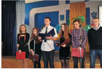
Учасники заходу студенти груп 21-Д, 25-Д